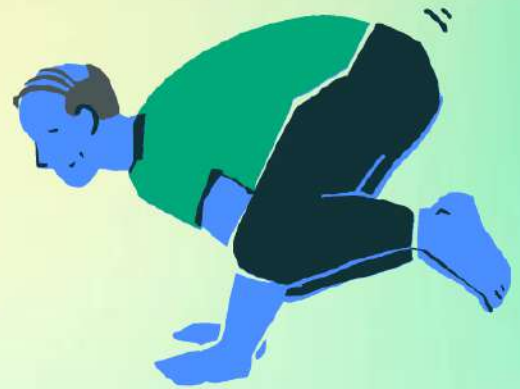
posture du corbeau